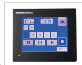
グラフィックパネル

操作感覚に優れたシートスイッチの「Vパネル」を標準装備。パネル操作で好みの回転数に自由に変更することができるので便利です。オプションで15工程30品目のレシピ登録ができるグラフィックパネルの装備も可能です。